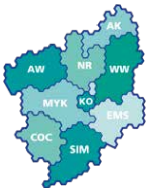
Landkreise des VRM:

Neben den dort dargestellten Zugverbindungen gilt das VRM-Gästeticket in allen Buslinien im gesamten Verbundgebiet (siehe auch QR-Code).